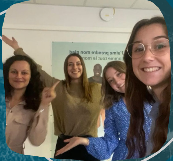
Célébration 1000 followers instagram