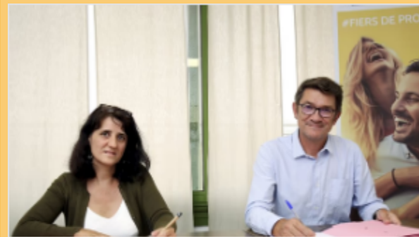
Aude : la Sécu associée à APF France Handicap pour faciliter accès aux droits et...