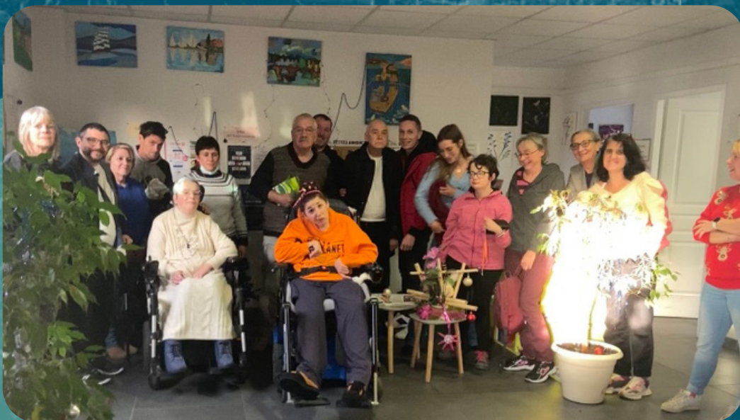
Goûter de Noël