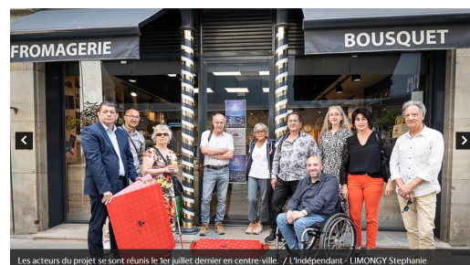
Les acteurs du projet se sont réunis le 7er juillet dernier en centre-ville.