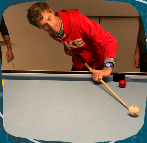
Après-midi billard au club billard LES REMPARTS