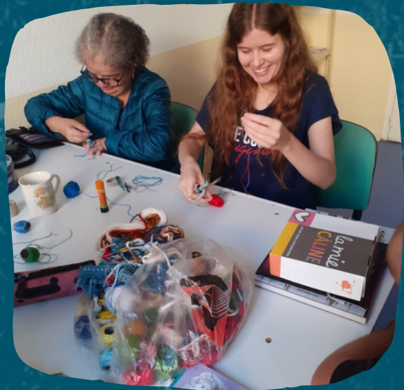
Scrapbooking au bureau de Narbonne