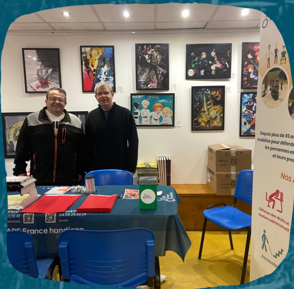
Opération papiers cadeaux à BD et Cie